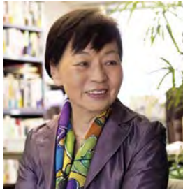
JT生命誌研究館館長・理学博士