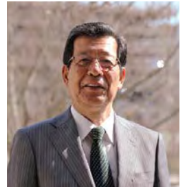
兵庫県立人と自然の博物館館長